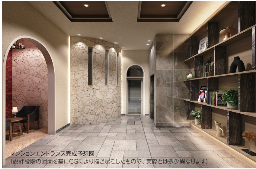
マンションエントランス完成予想図 (設計段階の図面を基にCGにより描き起こしたもので、実際とは多少異なります)